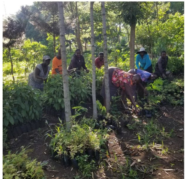
Membres de Murumba Star CBO à la pépinière

Le projet poursuit donc un triple objectif : assurer la sauvegarde durable de l'environnement, la sécurité alimentaire et la subsistance. Murumba Star CBO souhaite dès lors apprendre à la population les capacités nécessaires pour lier sauvegarde durable de l'environnement et sécurité alimentaire. En effet, l'intérêt d'une amélioration de la productivité du sol augmente de ce fait. C'est pourquoi des pratiques agricoles biologiques respectueuses de l'environnement seront enseignées et des forêts alimentaires seront créées afin de diminuer l'insécurité alimentaire. De cette façon, Murumba Star CBO souhaite continuer de lutter contre la déforestation et, dans le même temps, réaliser une augmentation de la production alimentaire. Le besoin de soutenir la subsistance des communautés locales sera comblé en enseignant des techniques d'agriculture durable, qui, dans le même temps, ne portent plus atteinte à l'environnement.