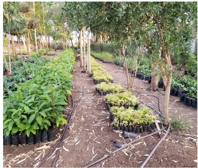
Les différentes essences d'arbres de la pépinière

appliquer pour protéger l'environnement, en plus de favoriser l'agriculture.