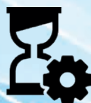
Project in uitvoering