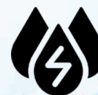
Water, sanitair en elektriciteit